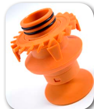
Nouveau déflecteur conçu par CAO

La gamme comporte 15 modèles taraudés (40 à 2500 m 3 /h) et 6 modèles chaudronnés à brides (de 2 150 à 25 500 m 3 /h)